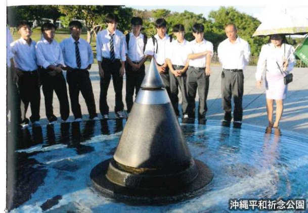
沖縄平和祈念公園